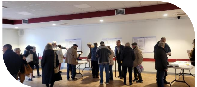
Le Forum PADD, entre 120 et 150 participants

Pour arriver à cette proposition, nous avons utilisé des méthodes innovantes. Par exemple, en mars, nous avons tiré au sort des habitants sur les listes électorales.