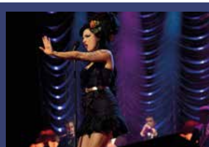
BACK TO BLACK

Rien n'avait préparé Eva à l'exigence d'un grand hôtel. En intégrant l'équipe des femmes de chambres, elle fait la connaissance de collègues aux fortes personnalités : Safietou, Aissata, Violette et Simone. Une équipe soudée face à l'adversité. Lorsqu'un mouvement social bouscule la vie du palace, chacune se retrouve face à ses choix.