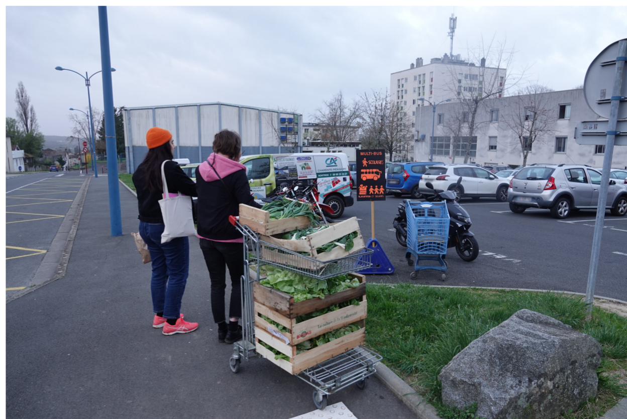
Test réalisé par les designers de l'ENSAD avec des denrées alimentaires