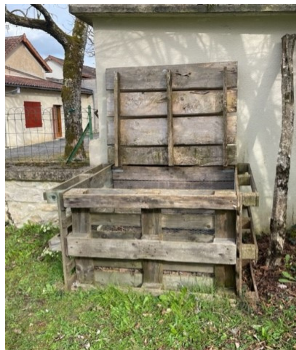
Composteur des logements communaux de Lussas et Nontronneau