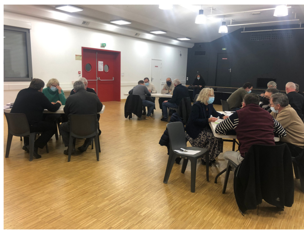
Commission PCAET janvier 2022 - Saint-Estèphe