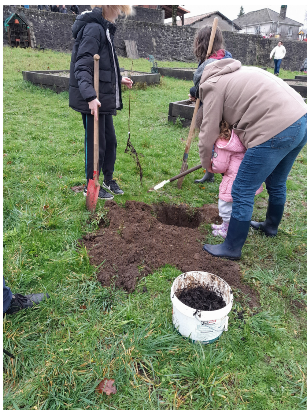
Plantation d'arbres aux abords de l'école de Piégut-Pluviers, 17 janvier 2023

En 2022, la commune de Saint-Pardoux-La-Rivière a adhéré à la plateforme de mobilité Atchoum. Grâce à ce service, les habitants de la commune ont accès à un service de covoiturage et de transport solidaire. Les conducteurs solidaires accordent de leur temps libre pour accompagner des personnes dans leur déplacement du quotidien (marché, rendez-vous médicaux, entretiens d'embauche).