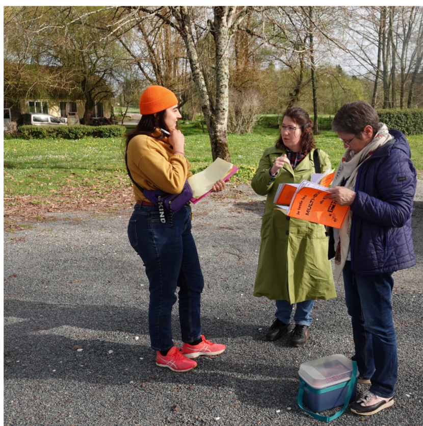
Test réalisé par les designers de l'ENSAD avec des salariées - Crédit photo : Jessica Brignola et Yannick Aly-Beril