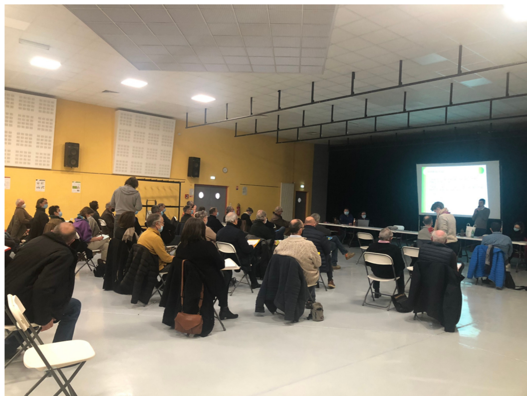
Réunion stratégique du 2 février 2022 - Nontron