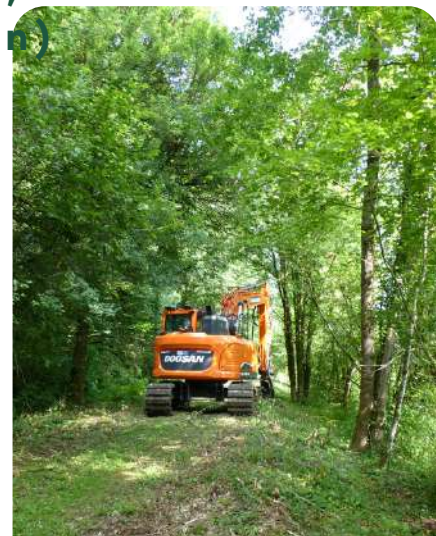
Travaux de débroussaillage mécanique (broyeur forestier monté sur une pelle)