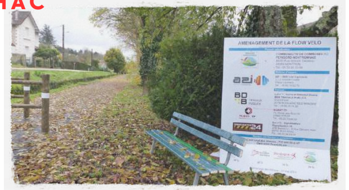
Les derniers aménagements de sécurité sur la Flow Vélo Octobre / Novembre 2023