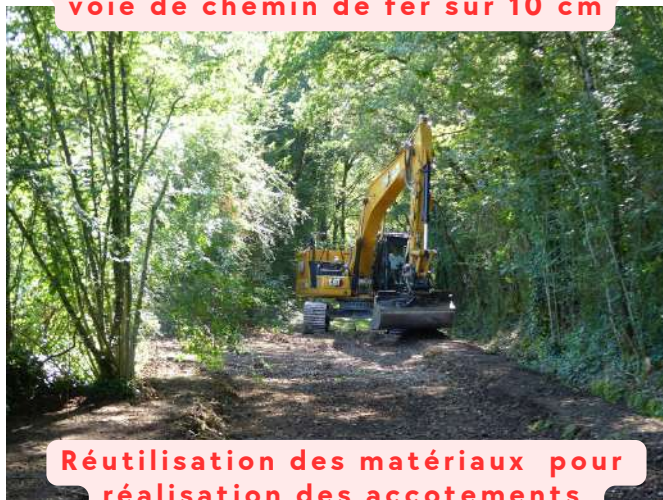
Réutilisation des matériaux pour réalisation des accotements