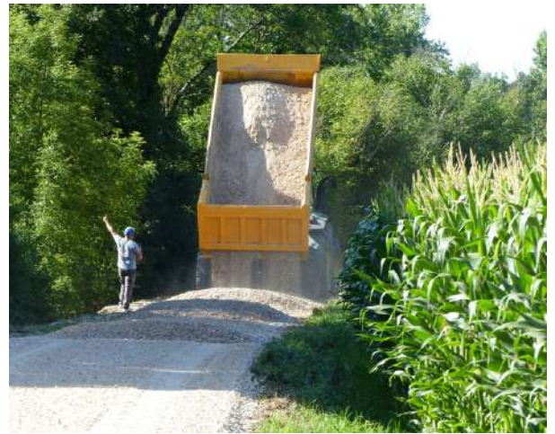
Empierrement et réglage des nouveaux matériaux