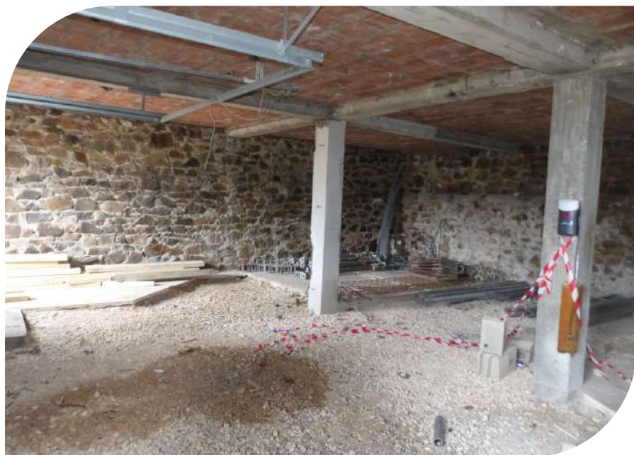
Un chantier de rénovation pour sécuriser ce bâtiment au cœur de Nontron et empreinte d'histoire.