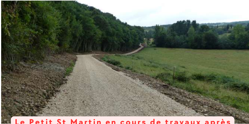
Le Petit St Martin en cours de travaux après terrassement et empierrement