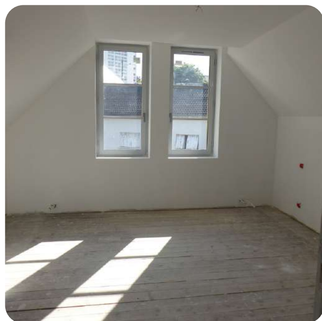
Laissé à l'abandon pendant près de 15 ans, la structure avait beaucoup souffert.