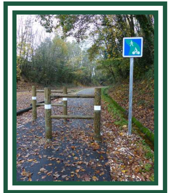
Réception des travaux le 21 novembre - Fin du marquage au sol et ouverture définitive courant décembre

Les travaux de la Tranche 1 prennent donc fin et ceux de la Tranche 2 (Nontron St Pardoux devraient débuter début 2 -ème trimestre 2024