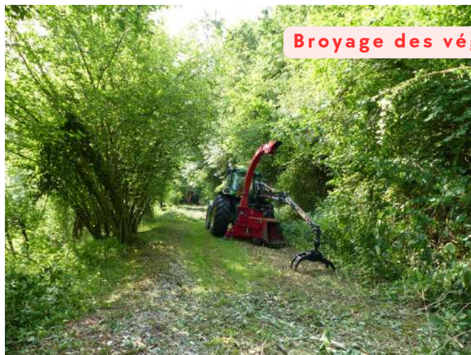
Broyage des végétaux sur place