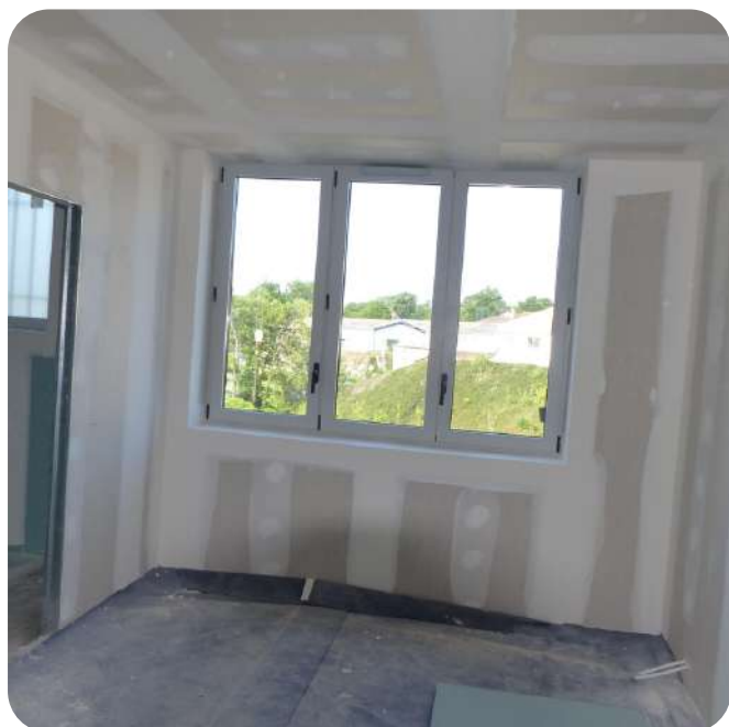
La rénovation de ce bâtiment s'est révélée plus complexe que prévu.