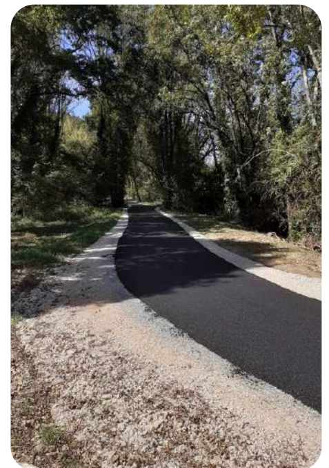
9 kilomètres d'enrobé entre Javerlhac et Nontron