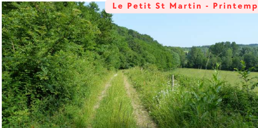
Le tracé retenu - Avant travaux - Le Petit St Martin - Printemps 2023