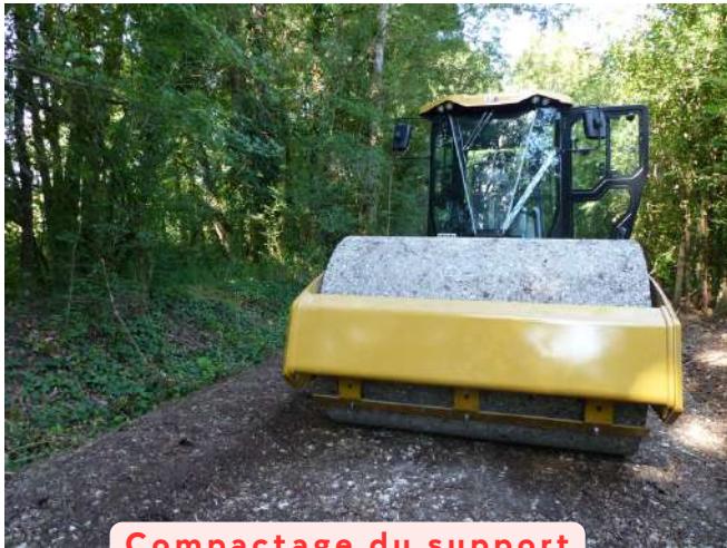
Compactage du support