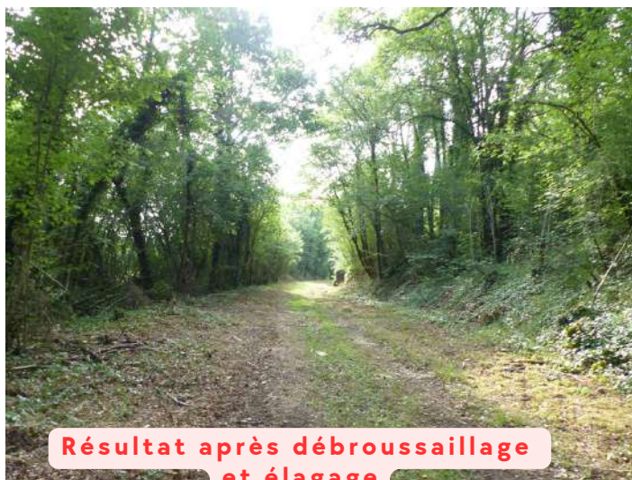
Résultat après débroussaillage et élagage